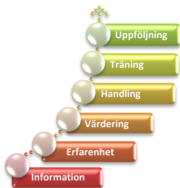
Trappmodellen för informationsöverföring och bearbetning av värderingar och attityder.

Kunskap är grunden till faktabaserade beslut och en förutsättning för att skapa engagemang hos ledning och personal. Kunskap är en del i CANEAs metoder för att ändra beteende. Det räcker ofta inte med att bara tillföra information för att få människor att handla annorlunda.