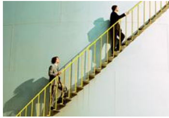
Utbildning i Förbättringsarbete – Kaizen Lean Six Sigma