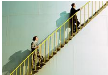
Utbildning i Förbättringsarbete – Kaizen Lean Six Sigma