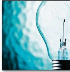
Förbättringsarbete Kaizen Lean Six Sigma