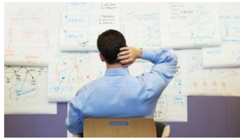
Utbildning i Avancerad Projektledning