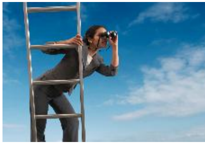
Utbildning i Projektkonomi