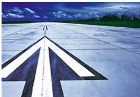
Företagsstrategi i praktiken