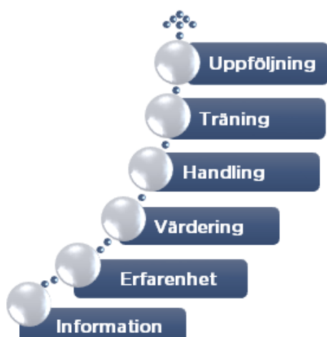
Trappmodellen för informationsöverföring och bearbetning av värderingar och attityder.

Vi håller både öppna och företagsinterna utbildningar. Kunskap är grunden till faktabaserade beslut och en förutsättning för att skapa engagemang hos ledning och personal. Kunskap är en del i våra metoder för att ändra beteende. Det räcker ofta inte med att bara tillföra information för att få människor att handla annorlunda.